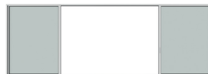
Großer Öffnungsbereich bei geöffneten Elementen